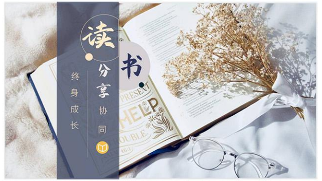
华宏集团开展“终身成长”读书分享会

江苏华宏实业集团有限公司主办 内部资料 2021年12月1日 第12期 总第196期 注意保存