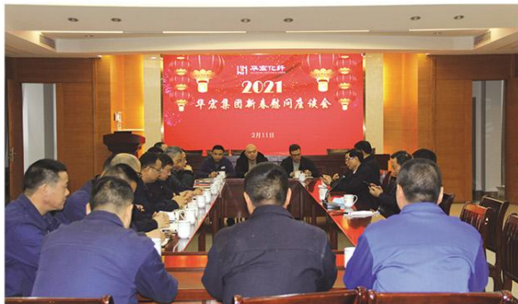
华宏集团董事会春节慰问一线员工

江苏华宏实业集团有限公司主办 内部资料 2021年3月1日 第3期 总第187期 注意保存